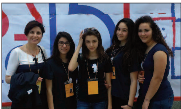
LE STUDENTESSE DELLA "MARIO NUCCIO"