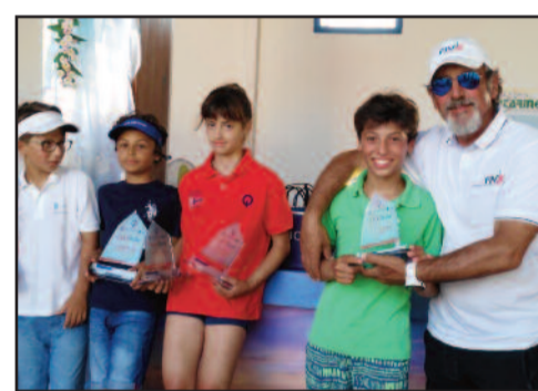
UN MOMENTO DELLA PREMIAZIONE

il vento instabile si è mantenuto sui 10-12 nodi, permettendo lo svolgimento di tutte e tre le prove previste; domenica, invece, la mattinata è cominciata con un vento leggero, che piano piano è aumentato di intensità, fino a raggiungere i 20 nodi. "Buone le prestazioni di tutta squadra - ha commentato l'allenatore Salvatore Prinziavalli - che è riuscita a difendersi bene. Il prossimo appuntamento è a Marsala, il 6 e il 7 agosto, proprio presso la Società Canottieri, per il Trofeo Massimo Attinà, valevole come prova di Coppa Sicilia. In questa occasione cercheremo di difendere al meglio i colori della nostra società".