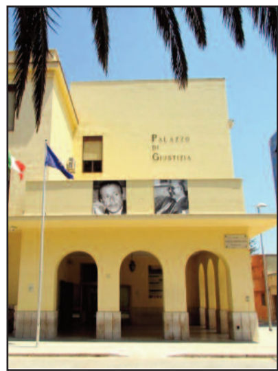
TRIBUNALE DI MARSALA