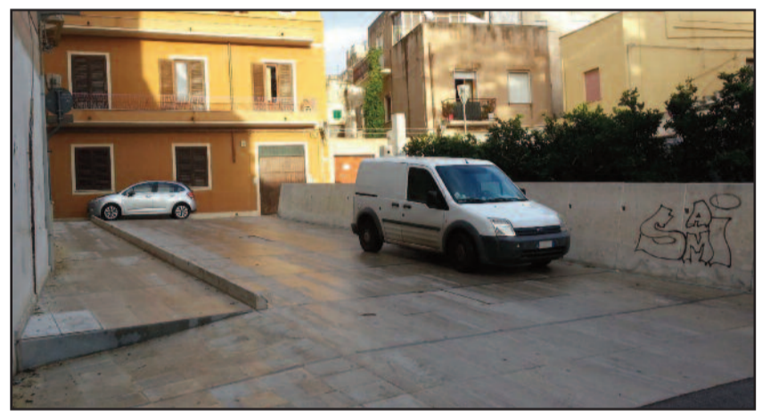
PIAZZA ALAGNA OGGI

NEL FRATTEMPO SI REGISTRANO GIÀ LE PRIME CRITICITÀ, DALLE SCRITTE DEI WRITERS ALLE BASOLE ROTTE