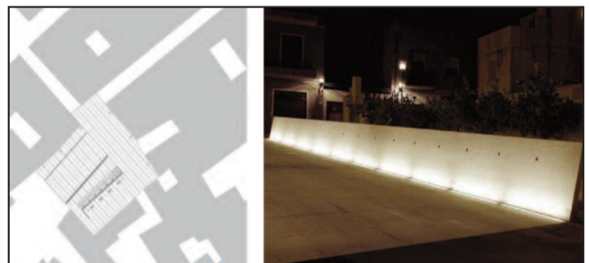
ASINISTRA IL PROGETTO, A DESTRA LA VERSIONE NOTTURNA ILLUMINATA