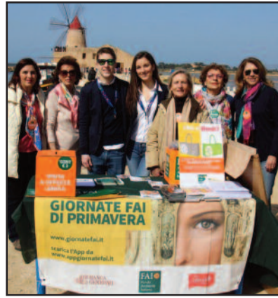
FOTO DI GRUPPO A MAMMACAURA