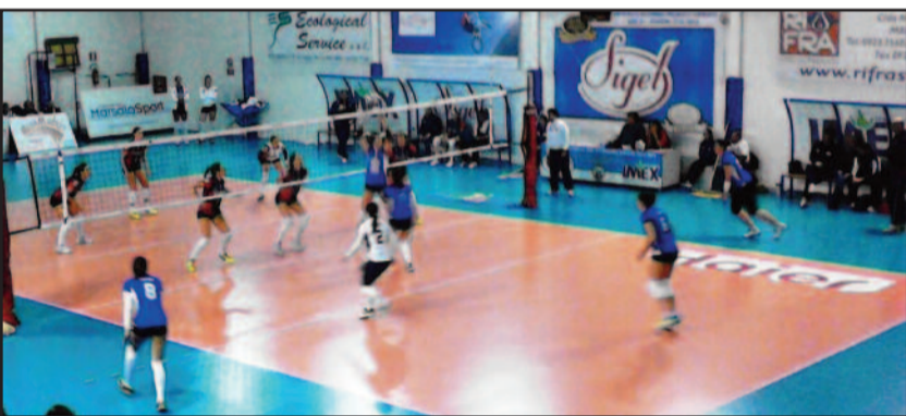
UN MOMENTO DEL MATCH DELLA SIGEL PALLAVOLO MARSALA