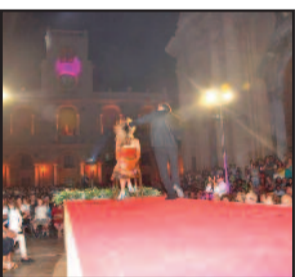
UN MOMENTO DELL'EDIZIONE 2014