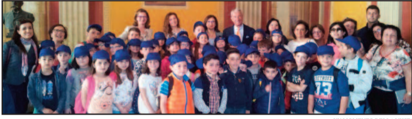
UN MOMENTO DELLA VISITA

pani con una e-mail esprimendo il desiderio di visitare la città senza pesare ulteriormente sulle proprie famiglie. Il loro desiderio è stato esaudito: il sindaco, infatti, oltre alla calorosa accoglienza riservata ha messo a disposizione degli alunni un bus turistico con il quale hanno potuto visitare i siti più importanti della Città, guidati da sei hostess dell'Istituto "Rosina Salvo". Dopo aver pranzato ad un famoso fast-food, i piccoli studenti sono stati accompagnati a visitare il santuario dell'Annunziata, meglio conosciuto come Santuario della Madonna di Trapani. [ claudia marchetti ]