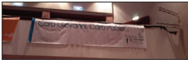
UNO STRISCIONE DEDICATO A GIOVANNI FALCONE E PAOLO BORSSELLINO