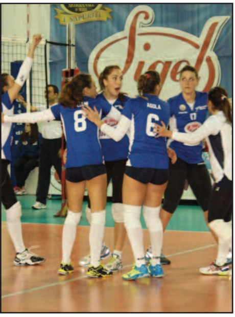
LA SIGEL - FOTO DI REPERTORIO