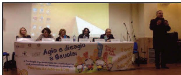
UN MOMENTO DEL CONVEGNO