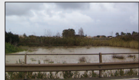
IL FIUME SOSSIO