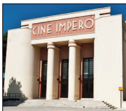
TEATRO IMPERO DI MARSALA

Conoscete la teoria dei "sette sosia"? E' quella teoria secondo cui per ognuno di noi, nel mondo, esisterebbero 7 doppioni, 7 controfigure, 7 uomini o donne tali e quali a noi. La natura umana può impegnarsi a mescolare le carte, ma le variabili, per quanto sterminate, risultano comunque finite e quindi soggette a ripetersi! E' questo il filo conduttore che guida il comico Gabriele Cirilli, reduce dal programma "Tale e quale show" di Rai Uno. Ed è