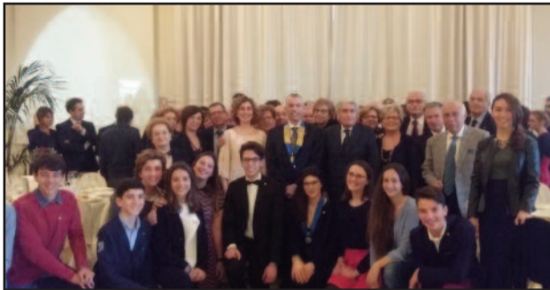
I SOCI DEL ROTARY CLUB MARSALA