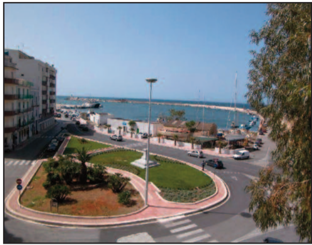
PIAZZA PIEMONTE E LOMBARDO - IL LUOGO DELL'INCIDENTE