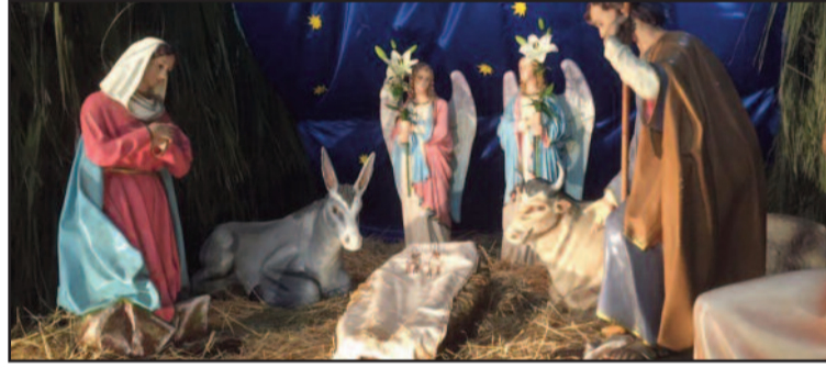
IL TRATTO DI STRADA OGGETTO DELLA SEGNALEAZIONE

“Accendiamo il Natale” è la manifestazione che è stata organizzata per queste festività 2015, dall'Amministrazione comunale di Petrosino. Quest'anno gli eventi natalizi avranno anche uno scopo benefico ben preciso, verranno organizzati tre concerti durante i quali la Caritas si occuperà della raccolta fondi per l'acquisto di defibrillatori ed inoltre, grazie alla collaborazione del Rotary Club, verranno organizzati dei corsi per l'utilizzo di queste preziose apparecchiature in grado di salvare la vita umana. Il programma di “Accendiamo il Natale” prosegue con tante altre iniziative: domenica 27 dicembre, con inizio alle ore 18, il Presepe vivente itinerante con la visita della Sacra Famiglia in Chiesa Madre e i