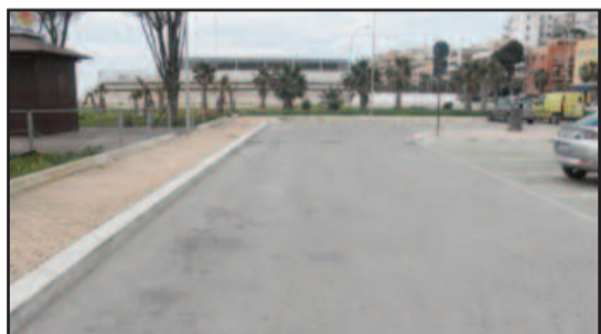
LA ZONA DEL SALATO

Vendita del pesce la domenica, come avevamo già scritto nei giorni scorsi, l'area del parcheggio del Salato lungo il litorale di Capo Boeo di fianco al monumento ai Mille, diventerà punto di attracco e vendita del pescato da parte degli operatori della piccola pesca. Questa decisione è stata presa sia per consentire la vendita del pesce concentrata in un'unica zona, sia perché attualmente il molo Colombo al porto di Marsala, tradizionale punto di attracco e vendita soprattutto la domenica e nelle giornate festive, si trova in stato di inagibilità. [...]"