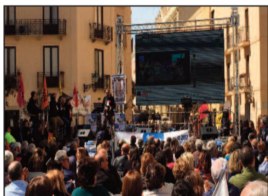
UN MOMENTO DELLA MANIFESTAZIONE