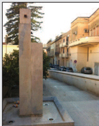
LA FONTANA DI PIAZZA ALAGNA

lista è apprezzabile il fatto che l'idea progettuale è stata studiata secondo gli schemi della ingegneria idraulica araba, con un sistema di risalita dell'acqua basato sul meccanismo delle chiuse. Realizzata con materiali autotoni, nerello di Custonaci e botticino di Sicilia, presenta due impianti di irrigazione della vegetazione impiantata, uno a canale e l'altro per sub-irrigazione. I lavori sono stati ultimati, tuttavia non è funzionante. Come mai? Manca ancora qualcosa? Ebbene sì, per un piccolissimo particolare, legato alla illuminazione e nello specifico al collegamento dei cavi elettrici per la distanza di 150 metri, non si può ancora mettere in funzione. La cruda verità è sempre la stessa, in una storica zona della città rivalutata da questo progetto, si vede un monumento incompiuto: i ragazzini del quartiere che ogni pomeriggio giocano nella piazzetta sicuramente sarebbero felici di sentir scorrere l'acqua. Inoltre non essendo in funzione la fontana appare