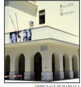
TRIBUNALE DI MARSALA

collegio difensivo con l'avvocato Giovanni Ingrassia - avendo rilevato la società dal fratello soltanto un mese e 10 giorni prima della sentenza di fallimento e non avendo la società Global Boat alcuna documentazione, sia Iva che contabile, sin dal 2006, non è stato in grado di fornire tale documentazione al curatore fallimentare che la richiedeva, non avendone la materiale disponibilità, ma comunque