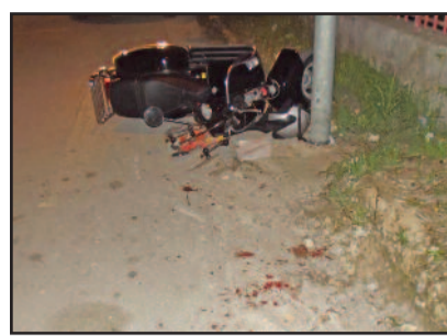
IL LUOGO DELL'INCIDENTE

strada - anche se non sulle strisce - quando è stato travolto dalla Vespa. Il motociclo, dopo l'urto con il pedone, ha battuto contro un'auto che era in sosta, ma fuori della carreggiata, ed fermandosi, in fine, contro un palo della luce. Sul posto sono intervenute due ambulanze del 118. Entrambe le persone coinvolte si sono fatte male e sono state trasportate in ospedale. Il giovane in moto si è procurato fratture al viso - ritenute guaribili in trenta giorni - ma sono decisamente peggiori le condizioni dell'anziano, che, per il colpo si è procurato un grave trauma cranico. Per lui è stato disposto l'immediato trasferimento all'ospede