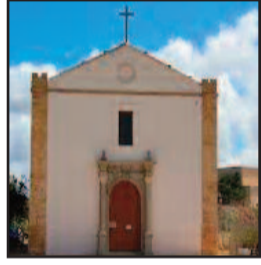
CHIESA DI SAN GIOVANNI