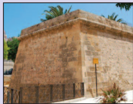
BASTIONE VELASCO DI MARSALA

Si inaugurerà sabato 24 giugno a Marsala, a partire dalle ore 18, "l'Orto Urbano Velasco",