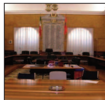
AULA CONSILIARE DI MARSALA