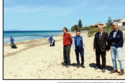
UN MOMENTO DELL'INIZIO DEI LAVORI