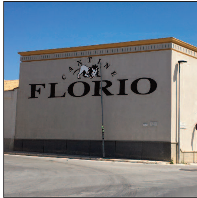
LO STABILIMENTO "FLORIO" DI MARSALA