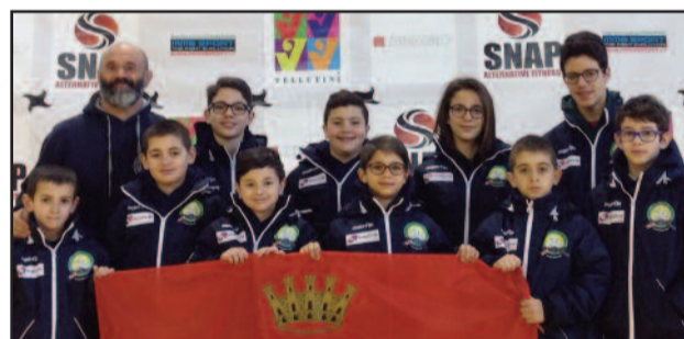
LA TRINACRIA BJJ ACADEMY