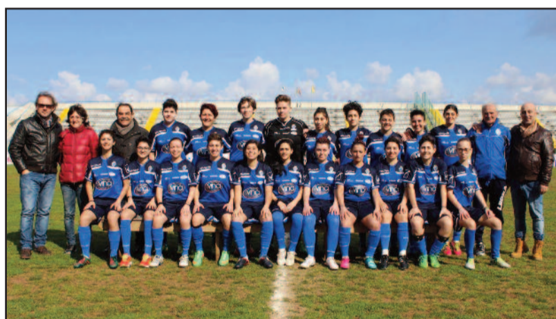
SC MARSALA 1912