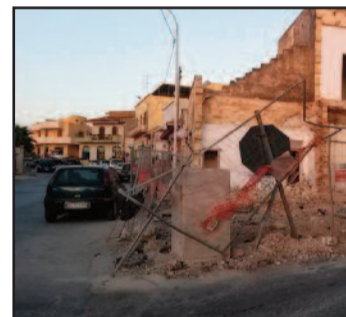
L'INCROCIO TRA PAOLINI E MATAROCCO

Tre persone sono rimaste ferite in un incidente stradale a Marsala. In particolare, ieri mattina, alle ore 10 circa, due autovetture si sono scontrate in contrada Amabilina. Si tratta di una Fiat Punto e di una Citroen C3, entrambe condotte da due uomini, rispettivamente di 56 anni e 70 anni. La Citroen non ha ottemperato al segnale di Stop andando a collidere contro la Fiat Punto, che stava percorrendo la strada con direzione di marcia verso la via Vita. A quel punto lo scontro è stato inevitabile e ha causato il ferimento di tre persone: i due conducenti delle autovetture coinvolte e la trasportata della Citroen C3, ovvero la moglie del conducente, una donna di circa 70 anni. Sul posto è giunta l'ambulanza del 118 che ha trasportato i tre feriti al Pronto Soccorso dell'ospedale "Paolo Borsellino", dove i medici hanno diagnosticato solo contusioni e ferite lievi. Il sinistro è stato rilevato dall'ispettore capo Tommaso Trapani, coordinatore della Squadra Infortunistica della Polizia Municipale. [ roberta matera ]