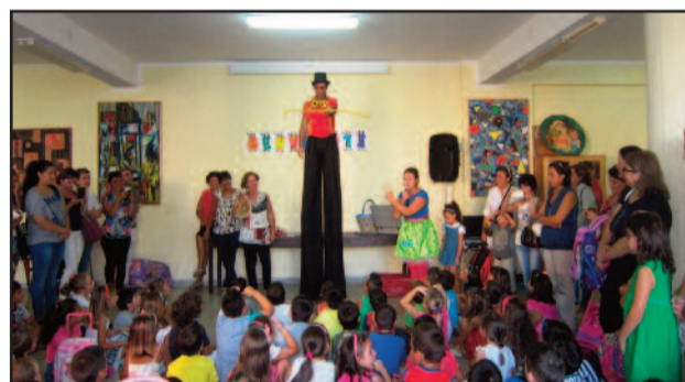
UN MOMENTO DELLA FESTA

Per i bambini i primi giorni di scuola rappresentano un'esperienza significativa densa di attese, di emozioni e, talora, di ansia. Il IV Circolo Sappusi, al plesso "Asta", consapevole dell'importanza che riveste tale esperienza nella vita del bambino e della sua famiglia, si è impegnata a creare le condizioni più favorevoli per accogliere gli alunni delle classi prime e i loro genitori. La scuola ha predisposto un'accoglienza "magica e gioiosa" con gli animatori "Birichini Party". I bambini sono stati coinvolti da un appassionante spettacolo di magia, trampoli e giochi con bolle di sapone, ideali per l'inizio di una nuova avventura.