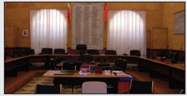
L'AULA CONSILIARE DI PALAZZO VII APRILE