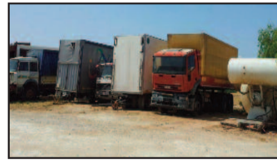
LA DISCARICA DI CAMION

luto riserbo. La zona delimitata con nastro bianco e rosso appartiene ad un privato cittadino ed è adiacente ad un'officina che però non avrebbe nulla a che vedere con l'area sottoposta a sequestro. Il luogo in questione si trova in contrada Samperi. Nella stessa contrada, a circa un chilometro di distanza, davanti all'ingresso dei vecchi stabilimenti della cantina Concasio, lo scorso 3 giugno, sono stati trovati uccisi due giovani tunisini e circa due anni fa la stessa sorte è capitata ad un marsalese di 67 anni,