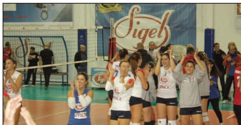
UN MOMENTO DELLA FESTA

Al termine di un match ben giocato e mai messo in discussione, la Sigel Pallavolo Marsala ha conquistato la