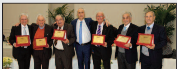
UN MOMENTO DELLA PREMIAZIONE