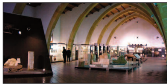
L'INTERNO DEL BAGLIO ANSEMI

A partire da mercoledì 16 novembre, il Museo Archeologico Regionale Lilibeo di Marsala rimarrà chiuso al pubblico fino a nuova comunicazione per il completamento espositivo previsto dai lavori POIn Progetto delle opere di valorizzazione del Museo sito al Baglio Anselmi di Capo Boeo. Resterà interamente fruibile la vasta area archeologica di Lilibeo con i suoi monumenti e la Chiesa di San Giovanni al Boeo con la sottostante "Grotta della Sibilla" e, su prenotazione, l'Ipogeo dipinto di Crispia Salvia. Per questo periodo transitorio verrà applicata la riduzione del 50% del biglietto d'ingresso. [ c. m. ]