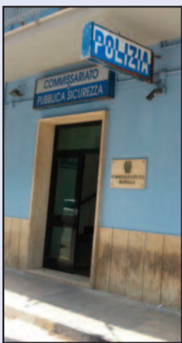
IL COMMISSARIATO DI VIA VERDI