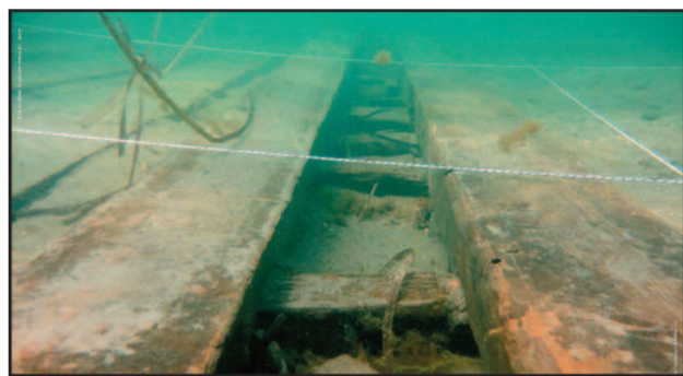
IL RELITTO DELLA NAVE ROMANA