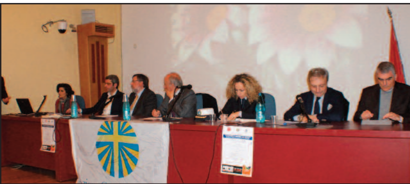
UN MOMENTO DELL'INIZIATIVA