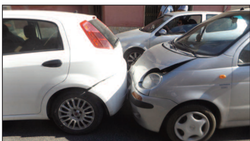
IL LUOGO DELL'INCIDENTE