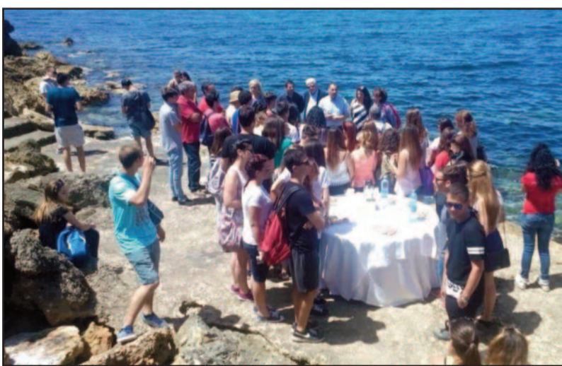
UN MOMENTO DELL'INIZIATIVA

Nei giorni scorsi, a Petrosino, l'Amministrazione comunale, con sindaco e Giunta al completo, ha accolto due scolaresche provenienti, rispettivamente, dalla Bulgaria, i ragazzi della 3° liceo "Hristo Vratsa", e da Palermo, quelli del Liceo Classico Europeo "Maria Adelaide". Entrambe le due classi fanno parte di un gemellaggio previsto dal Progetto Europeo Comenius, che ha come obiettivo la sensibilizzazione dei cittadini europei alla salvaguardia e tutela delle specie a rischio, sia flora che fauna, e allo stesso tempo alla promozione dei territori che, grazie a queste specie possono offrire un turismo consapevole. Le scolaresche sono state ricevute in località Biscione, alla Piattaforna.