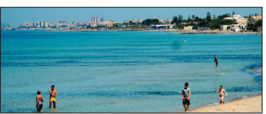
LA SPIAGGIA DI MARSALA (FOTO DI REPERTORIO)