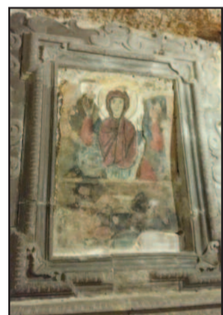
Orante è la presenza diretta di Maria accanto alla Chiesa. [...] ...continua in quarta