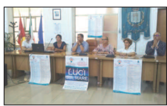
UN MOMENTO DELLA CONFERENZA STAMPA