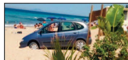
L'AUTO IN SPIAGGIA (ZONA SBOTTO)

Un incidente è avvenuto ieri mattina nei pressi del Lido Gazebo in zona "sbocco" a Marsala. Un anziano, colpito da malore è finito con la sua auto direttamente in spiaggia, a pochi metri dalla riva. Fortunatamente l'incidente, che poteva avere conseguenze ben più gravi, non ha coinvolto i bagnanti, che si trovavano proprio nei pressi della riva, anche perché la sabbia ha bloccato la "corsa" dell'auto. L'uomo però, colpito da malore, è stato soccorso e trasportato con un'ambulanza al nosocomio marsalese per accertamenti. Sul posto sono intervenuti anche i Vigili urbani e i Carabinieri.