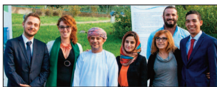
GLI ORGANIZZATORI CON LO SCEICCO

punti di riferimento credibili per gli imprenditori che hanno già investito in quelle zone. A proposito dell'iniziativa tenutasi al Baglio Basile, gli stessi puntualizzano che il costo di € 300.00 che ogni imprenditore partecipante ha affrontato nell'ambito dell'incontro con lo Sceicco Salim Al Hashmi, è servito agli organizzatori per coprire le spese per i servizi offerti (sala meeting, traduttori, pranzo, transfer, consulenza, personale...) e che tale cifra non è stata incassata dallo Sceicco ma dalla società organizzatrice Concept Development LLC. Appartenente ad una delle famiglie più importanti dell'Oman, Salim Al Hashmi ha contatti diretti non solo con sua maestà il Sultano Qaboos bin Said Al Said, da cui