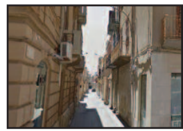
VIA FRANCESCO ANGILERI