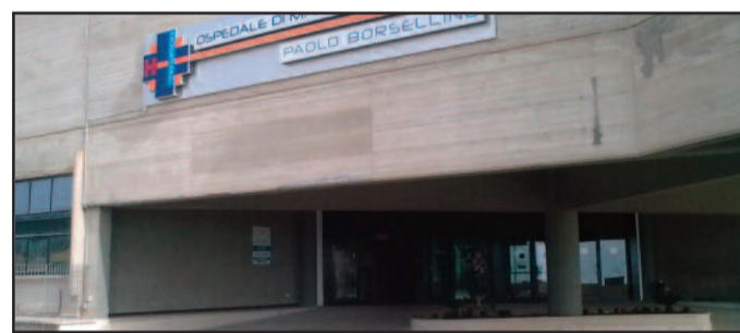
L'INGRESSO DEL "P. BORSELLINO"