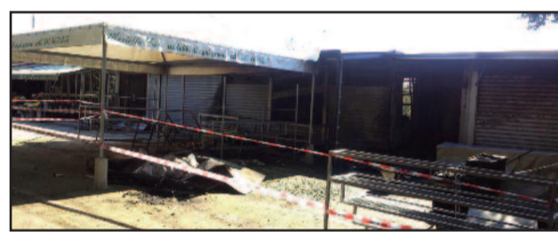
UN MOMENTO DELLA CERIMONIA DELLA CONSEGNA

centrale il cui titolare è M.D.G., ma è gestito dalla moglie. Dentro c'era una cella frigorifera, fiori e impianti. Tutti sono stati ridotti in cenere. Nel secondo chiosco, gestito da A. M., invece non c'era corrente elettrica, ma è stato ridotto in un groviglio di lamiere annerite. Quanto alle cause, attualmente non sono note. Infatti non sono stati trovati segni di effrazione e le saracinesche erano chiuse. Tant'è che i vigili del fuoco, per entrare e spegnere il fuoco hanno dovuto tagliarle. Tuttavia non è possibile trascurare un particolare: la parte superiore delle saracinesche del chiosco centrale erano del tipo traforato e non si può escludere che qualcuno possa aver introdotto un innesco. Si tratta però di ipotesi non avvalorate visto che i vigili non hanno trovato tracce di combustibile. Sul caso indaga il commissario