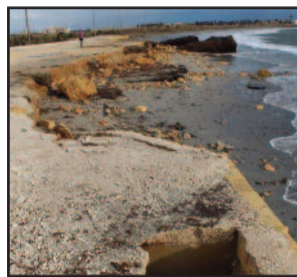
IL LITORALE DI TORRAZZA