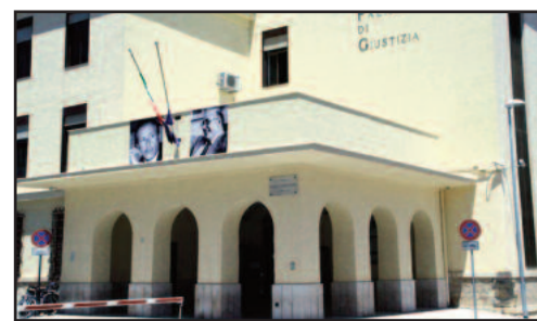
TRIBUNALE DI MARSALA