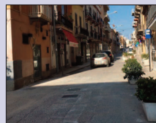
VIA ANCA OMODEI

Dopo le festività natalizie Marsala è tornata caotica. Questa volta per via di alcune vie del centro storico, principalmente la via Gagini e la via Anca Omodei chiuse al