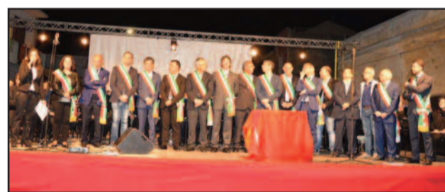
I SINDACI DELLA PROVINCIA