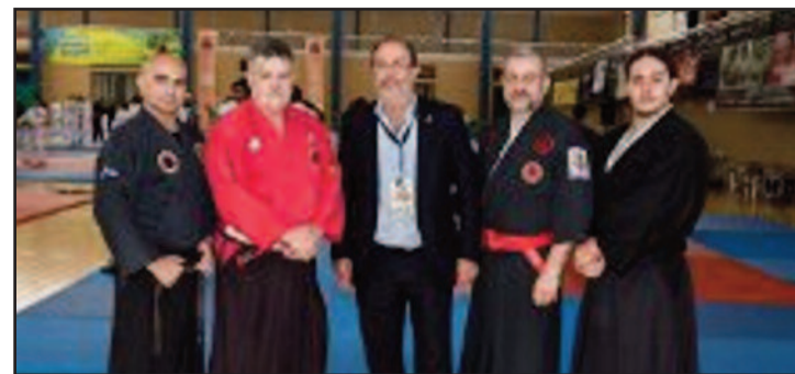
L'OTONASHI A TENERIFE