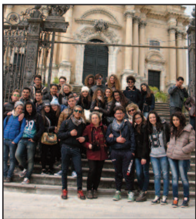
FOTO DI GRUPPO

La cerimonia di premiazione del Concorso Sipario Scuola 2015, svoltasi lo scorso 20 marzo presso la Camera di Commer-