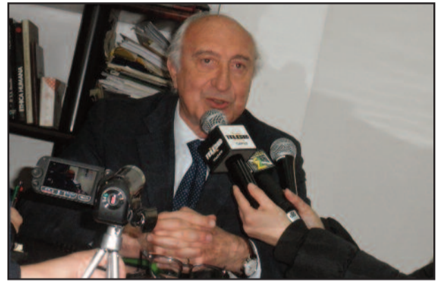
L'EX SINDACO DURANTE LA CONFERENZA STAMPA

prima persona, ma vedevo una cappa su Marsala. Un'autentica lotta a chi doveva salire sul carro del Pd. Avevo la sensazione che sarebbe stato una sorta di referendum rispetto a un unico candidato. E credo che una città di 90.000 abitanti dovrebbe essere nelle condizioni di scegliere. Poi, mi sono stancato di vedere Marsala vassalla di altri territori. Dietro lo schema che abbiamo di fronte c'è un'organizzazione ben precisa degli assetti regionali e nazionali. Noi stiamo pagando l'assenza di rappresentanti politici espressi dalla città. Una situazione che non possiamo più tollerare". [ ... ]