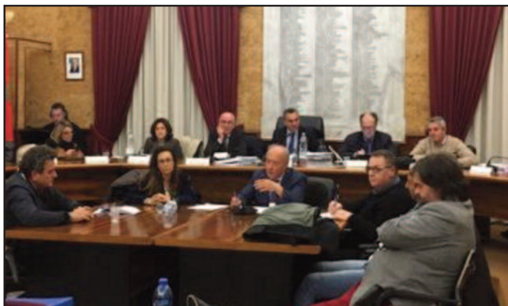
UN MOMENTO DELLA SEDUTA

Torna a riunirsi questo pomeriggio il Consiglio comunale di Marsala. Dopo i "botti" di lunedì pomeriggio, dovrebbe essere una serata tutto sommato tranquilla per l'amministrazione comunale con l'approvazione del Rendiconto dell'esercizio finanziario 2016 (o bilancio consuntivo, nella denominazione tradizionale). Il 5, invece, Sala delle Lapide presumibilmente tornerà ad animarsi in occasione di una seduta interamente dedicata alle interrogazioni, alla presenza del sindaco Alberto Di Girolamo. In attesa di conoscere le nuove deliberazioni del massimo consesso civico, vale però la pena fare un passo indietro e tornare ai lavori della seduta di lunedì sera, che hanno fatto registrare un'altra delicata tappa nell'"autunno caldo" della politica marsalese. Com'era prevedibile, i vari gruppi hanno ripreso il confronto con il sindaco Alberto Di Girolamo laddove si era interrotto prima della campagna elettorale per le regionali, tornando a chiedere maggiore dialogo e coinvolgimento nelle scelte amministrative. Rispetto ai tempi della complessa ap-