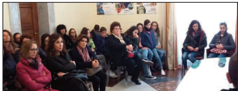
UN MOMENTO DELL'INCONTRO

cato funzionamento dell'impianto di riscaldamento e altre criticità con cui quotidianamente deve misurarsi la popolazione scolastica del "Giovanni Paolo II", a partire da alcuni atti vandalici verificatisi nei giorni scorsi. Il primo cittadino e l'assessore hanno assicurato che al più presto verrà effettuato un sopralluogo e che a gennaio i termosifoni torneranno in funzione, in seguito alla sostituzione della caldaia.