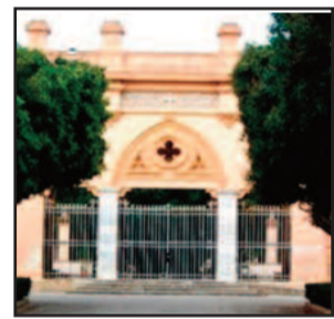
L'INGRESSO DEL CIMITERO DI MARSALA

Il settore Servizi Pubblici Locali del comune di Marsala, ha reso noto che si terrà il prossimo 26 giugno la gara a cottimo fiduciario per "Lavori di estumulazione, traslazione e ritumulazione di feretri all'interno del cimitero urbano". La base asta ammonta a poco più di 25mila euro.