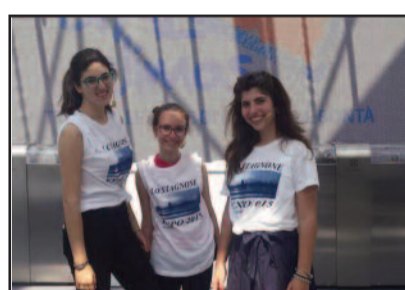
LE STUDENTESSE DEL CLASSICO ALL'EXPO