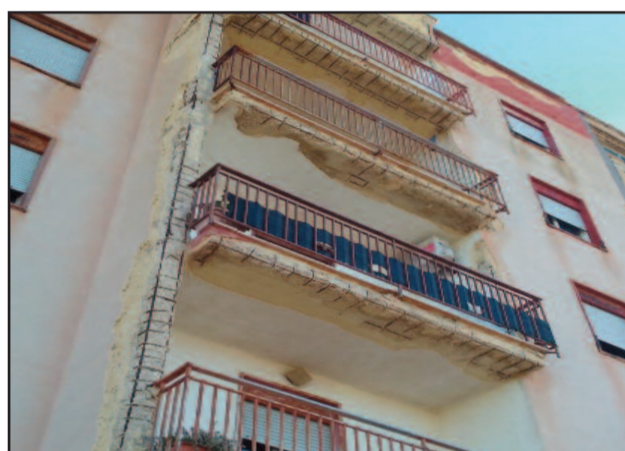
LA PALAZZINA DI SAPPUSI

Nel frattempo è giunta una nota dall'IACP che così scrive in merito: "Il ripristino dei prospetti è inglobato in un intervento progettuale ampio, il cosiddetto "contratto di quartiere", la cui esecuzione progettuale è stata oggetto di gara di appalto definita dal Comune di Marsala. Esiste infatti una convenzione stipulata tra il Comune e l'IACP di Trapani proprietario degli immobili, laddove si evidenzia lo stato di preclusione per l'Ente ad intervenire sugli immobili su cui sono stati autorizzati i lavori. Ciò per evitare di interferire con le attività di cantiere formalmente intraprese dall'Amministrazione comunale stessa per le quali era emersa una diatriba con il competente Assessorato, che si è risolta in questi giorni grazie ad un intervento dell'Amministrazione". Anche l'Ente Autonomo ha avuto assicurazioni da parte dell'Amministrazione Comunale, che a breve riprenderanno gli interventi di manutenzione. [ c. m. ]