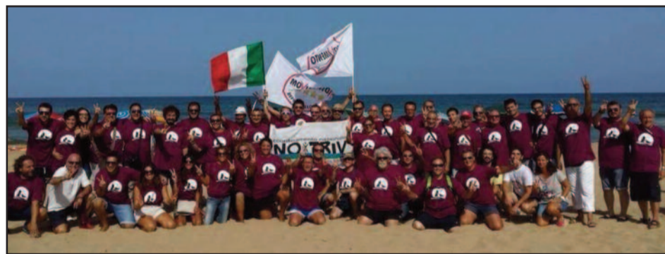
UN MOMENTO DELL'INIZIATIVA

I meet up del territorio trapanese, nonché i cittadini si sono ritrovati domenica, al Lido San Giuliano di Erice, per la manifestazione di protesta contro l'art. 38 del Decreto "sbloccitalia" che autorizza di fatto le trivellazioni nei nostri mari. L'evento ha toccato diverse regioni in tutta Italia, e il 6 Settembre ai è tenuta la giornata conclusiva che ha visto protagoniste le città di Trapani e Bari. Il Movimento 5 Stelle si è da sempre battuto contro queste scellerate leggi che danneggiano l'ambiente come patrimonio di tutti. "Da cittadini attivi non possiamo