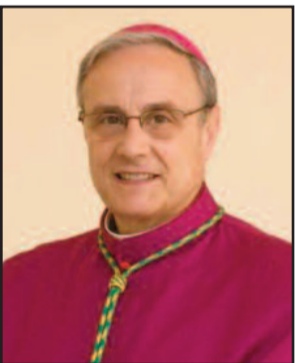
MONSIGNOR DOMENICO MOGAVERO

Si terrà al Complesso Monumentale San Pietro di Marsala, questa sera alle ore 21.30, la proclamazione del "Vangelo di Matteo". Su un testo di Matteo Levi, il pubblico, su musiche di Antonio Pappalardo, orchestrazione di Fabio Castorino, con le immagini di Kalina Stoppel, il programma prevede, dopo i saluti del sindaco, l'introduzione del Vescovo della Diocesi di Mazara del Vallo, Monsignor Domenico Mogavero. Alle 21,50 invece ci sarà la presentazione dell'opera da parte del compositore Antonio Pappalardo e a seguire la proclamazione della Settima parte del "Vangelo di Matteo". Alle 23 si aprirà un dibattito sul tema. L'ingresso è libero.