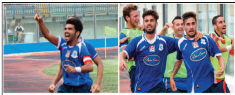
ALCUNI MOMENTI DELLA PARTITA