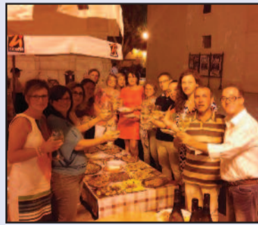
UN MOMENTO DELL'INIZIATIVA