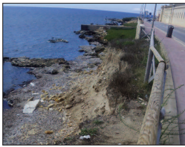
UNA PARTE DEL LUNGOMARE

dell'inverno scorso, con la conseguenza che, trattandosi di terreno di riporto, si potrebbe verificare da un momento all'altro il franamento del marciapiede e della strada. Considerato il notevole traffico di passanti e di automezzi che transitano sul Lungomare, che funziona come circonvallazione della città, il cedimento della parte di strada in oggetto potrebbe arrecare rischio all'incolumità pubblica oltre che un notevole danno per le casse comunali". Alla luce di ciò, il vicepresidente del Consiglio comunale invita l'amministrazione a prendere urgentemente provvedimenti a garanzia dell'incolumità pubblica e a dare disposi-