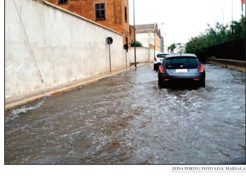
ZONA PORTO

Basta che piova per mezz'ora e Marsala va letteralmente in tilt. Il problema è sempre lo stesso. Essendo Marsala per buona parte costeggiata dal mare, accade ogni anno che le vie di fuga delle acque bianche, si ostruiscono con le alghe che, depositandosi, in banchi, lungo la costa crea una specie di sponda. In pratica, per evitare tutto ciò, sarebbe necessaria una continua e periodica manutenzione e pulizia. Fatto sta che per via delle piogge cadute nel week end sono stati registrati disagi in varie strade del Marsalese. La situazione peggiore si è verificata proprio sul lungomare Mediterraneo. Qui si è verificato un allagamento tale da richiedere l'intervento dei Vigili del Fuoco del distaccamento di corso Calatafimi. Altri disagi sono stati segnalati anche in via Verdi dove la strada si è trasformata in un fiume, e in via Ponte Samperi. Il rischio è che si verifichi quanto già accaduto in passato ossia l'esplosione dei tombini. L'ultima volta è accaduto nei primi di set-