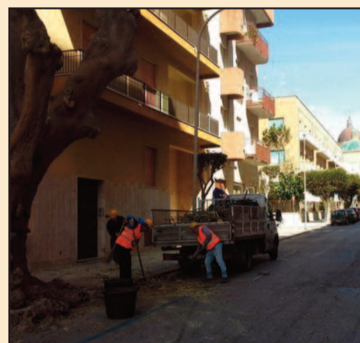
VIA SCIPIONE L'AFRICANO

È in corso la potatura degli alberi in via Scipione l'Africano. Al fine di non creare intralcio alla circolazione veicolare, l'intervento si svolgerà nell'arco di tre giornate e per tratti della centralissima arteria che conduce nel centro storico. Ieri gli operatori comunali del verde pubblico hanno ultimato la potatura dal lungomare fino all'incrocio con via delle Sirene. Apposita segnaletica, infatti, era stata collocata nei giorni scorsi dalla competente sezione della Polizia Municipale per tenere sgombri da auto entrambi i lati di via S. L'Africano anche nel tratto che arriva fino a Piazza Mameli.