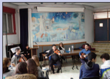
UN MOMENTO DEL CONCERTO