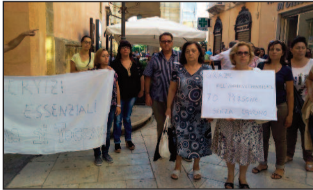
LE PROTESTE DEI LAVORATORI E DELLE FAMIGLIE

strati invece cittadini e i lavoratori del settore a mettere in moto tutta una serie di iniziative. Sabato scorso i lavoratori impegnati nel settore, hanno inscenato una protesta davanti al Palazzo del Municipio. Poi è stata la volta dei