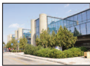
AEROPORTO DI BIRGI