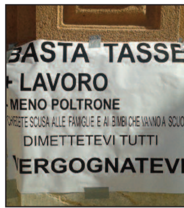
UN CARTELLO AFFESSO A PALAZZO VII APRILE

biamo cercato di farci dire dal vice sindaco come tecnicamente è potuto accadere che l'Amministrazione abbia fatto ricorso a tali tagli. "A causa dell'anticipo del Bilancio di cassa dal 2016 al 2015 operato dalla Regione - ci ha detto Licari -, abbiamo dovuto trovare immediatamente circa un milione e mezzo di euro per operare il pareggio di bilancio. È chiaro che nessuno di noi si sogna di aumentare le tasse, ma nessuno può pensare che avremmo potuto avviare il comune di Marsala verso il default". Per scongiurare questo pericolo, sostiene il vice sindaco, si è provveduto a proporre al Consiglio comunale l'aumento della Tasi, proposta che è stata bocciata con il voto determinante di larghi settori della maggioranza. "Stiamo fin dal nostro insediamento, operando una seria politica di spending review - afferma il vice sindaco -, ma è chiaro che entro poche settimane non potevamo reperire i fondi necessari per il pareggio di bilancio. Dopo la bocciatura della no-