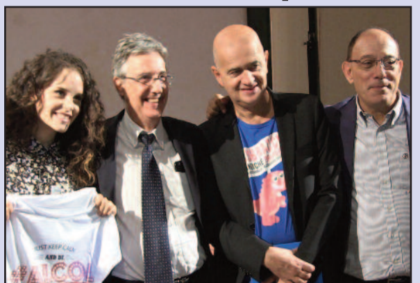
L'VERTICIAICAT CON L'ATTRICE GIULIA LUZI