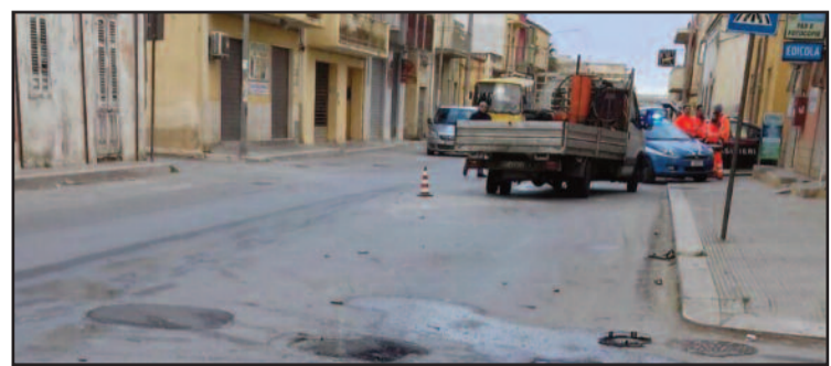
IL LUOGO DELL'INCIDENTE

Nuovo incidente stradale ieri mattina a Marsala. Il sinistro è avvenuto in contrada Strasatti intorno alle 7,15. Una autovettura del tipo Lancia Libra stava effettuando un sorpasso andando a sbattere contro un automezzo di una ditta che proveniva dal senso opposto di marcia, invadendo quindi la carreggiata. Il conducente della Lancia è rimasto ferito, riportando alcune contusioni. Per tale motivo è stato trasportato da un'ambulanza del 118 all'ospedale "Abele Ajello" di Mazara del Vallo. Al momento non è in condizioni che possano destare preoccupazione. Sul posto sono intervenuti i Carabinieri e una volante del Commissariato di Polizia, mentre la ditta Ecolisia ha ripristinato la carreggiata dai detriti lasciati dallo scontro.