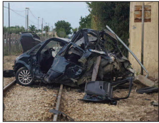
L'AUTO DISTRUTTA NELL'INCIDENTE

l'impatto. La vettura, dopo essere stata investita dal treno, si è capottata sui binari accartocciandosi su sé stessa. Per liberare la donna dalle lamiere sono intervenuti i Vigili del Fuoco. Immediatamente soccorsa è stata trasportata al pronto soccorso dell'Ospedale Paolo Borsellino dove si trova tutt'ora in fase di osservazione. La donna ha riportato alcune ferite (fratture ossee con prognosi di qualche mese) ma fortunatamente non risulta in gravi condizioni. Sul posto la Polfer che ha effettuato i rilevamenti del caso e i Vigili urbani. Presto ulteriori aggiornamenti. Non si sa se per un guasto tecnico o per precauzione, ma tutti i passaggi a livello nelle vicinanze sono rimasti bloccati per mezz'ora dopo l'incidente.