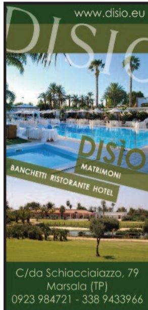
C/da Schiacciaiazzo, 79 Marsala (TP) 0923 984721 - 338 9433966