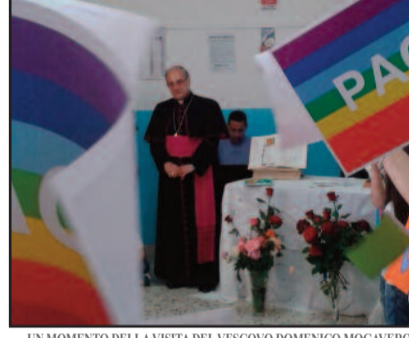
UN MOMENTO DELLA VISITA DEL VESCOVO DOMENICO MOGAVERO

Celebrazione Eucaristica da lui presieduta, a seguire i colloqui personali, alle 11 la Celebrazione Eucaristica, alle 12.15, visita al cimitero comunale, alle 13.30 la visita al Comando della Stazione dei Carabinieri e pranzo, alle 18 la solenne Celebrazione con l'atto di affidamento del sindaco a Maria SS. delle Grazie. A seguire la processione per le vie della Città. Domani, 1° giugno, dalle 9 visita agli ammalati, alle 11.15 visita alle case di riposo "San Francesco", "Santa Maria Regina" e "Villa Azzurra", alle 12.30 incontro con l'Amministrazione comunale e a seguire pranzo con il sindaco in Parrocchia, alle 16.30 e alle 17.30 visite alle cantine sociali "Petrosino" e "Aurora", alle 18.30 visita alle