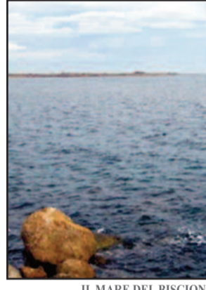
IL MARE DEL BISCIONE

Biscione: ritrovato in buone condizioni il sub disperso