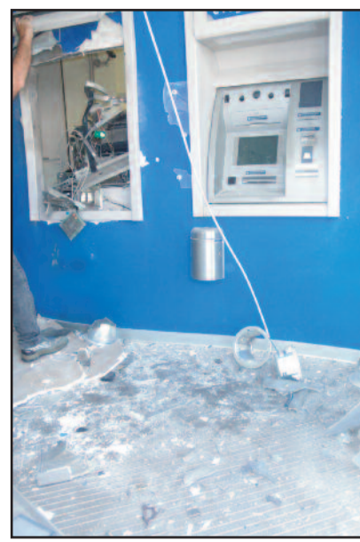
L'INTERNO DELLO SPORTELLINO BANCOMAT DANNEGGIATO

uomini del commissariato di pubblica sicurezza di Marsala, che stanno indagando sull'episodio, con il supporto della polizia scientifica, in modo da individuare la natura dell'ordigno. Tra le ipotesi più accreditate, la possibilità che si trattasse di una molotov artigianale. La vicenda, per certi versi, ricorda quella avvenuta qualche settimana fa a Strasatti. In quel caso, gli autori del tentato furto prelevarono la cassaforte, ma dopo averla trascinata per strada per un po', non riuscendo ad aprirla, decisero di abbandonarla dandosi alla fuga.