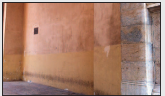
L'INTERNO DI PORTA GARIBALDI