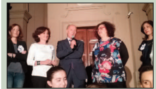
UN MOMENTO DELL'INIZIATIVA