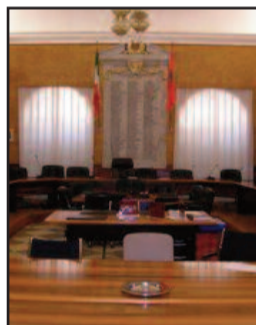
SALA DELLE SEDUTE

Il Consiglio comunale di Marsala è aggiornato a questo pomeriggio, alle ore 16.30, nella sede istituzionale di Palazzo VII Aprile in Piazza della Repubblica, per proseguire la trattazione degli argomenti posti all'ordine del giorno già diramato l'11 maggio scorso. Sono ben 88 i punti all'Od.G. che dovranno essere trattati in seno al Massimo Consesso Civico, di cui alcuni sono stati già approvati o bocciati. Tra questi, diversi sono gli atti di indirizzo e le mozioni presentati, nonché il riconoscimento dei debiti fuori bilancio.