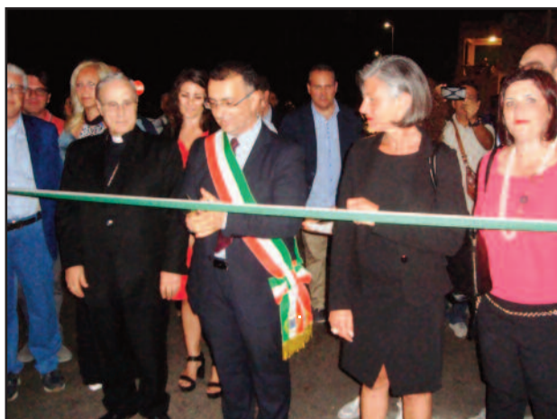
UN MOMENTO DELL'INAUGURAZIONE

st'anno abbiamo tante novità in calendario e che è possibile visualizzare il programma completo di Petrosino Estate 2015 sul nostro portale turistico www.visitpetrosino.com . Il prossimo appuntamento con Petrosino Estate 2015, sarà giovedì 2 luglio con la prima serata della rassegna Cine@mare, con la proiezione del film "Le Meraviglie" della regista italiana Alice Rohrwacher, già vincitore del Gran Premio della Giuria al 67esimo Festival del Cinema di Cannes. [ ro.ma. ]