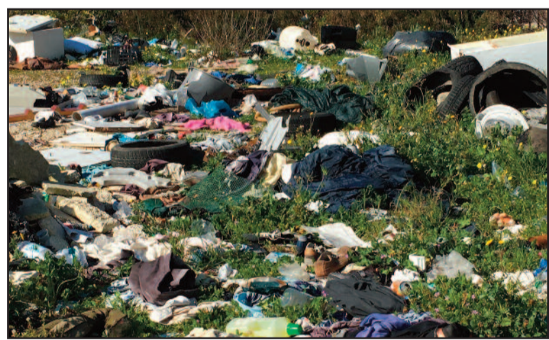
LA DISCARICA DI CONTRADA GIUNCHI