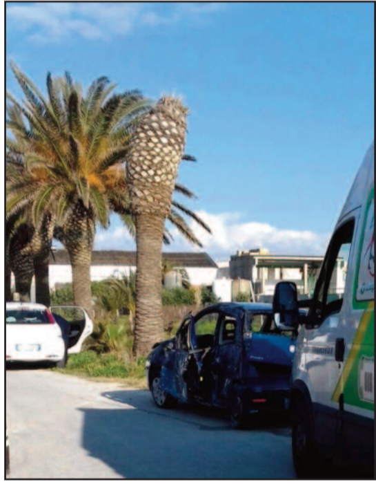
IL LUOGO DELL'INCIDENTE

Grave incidente sul Lungomare Mediterraneo a Marsala nel primo pomeriggio di ieri. Nei pressi del rifornimento Adamo Petroli, una ragazza al volante di una Fiat Punto di colore, per ragioni ancora da accertare, è andata a sbattere contro il muro di una cantina. Pare un incidente assolutamente autonomo. La giovane di 22 anni, a causa dell'impatto, ha subito un colpo molto violento. Sul posto sono intervenuti i Vigili urbani della locale Polizia Municipale. Ma si è reso necessario anche l'intervento della squadra dei Vigili del Fuoco del distaccamento di Corso Calatafimi per estrarre la ragazza dalle lamiere all'interno dell'abitacolo. Dopo, la ditta Ecolisia, ha ripristinato la sede stradale dai detriti. L'ambulanza del 118 ha urgentemente trasportato la 22enne all'ospedale "Paolo Borsellino" di Marsala. Qui i medici hanno giudicato la ragazza in gravi condizioni tanto da trasportarla all'ospedale di Palermo. La Polizia Municipale chiarirà i motivi che hanno portato la giovane a perdere il controllo della sua autovettura in un tratto di strada in cui bisogna sempre prestare molta attenzione.