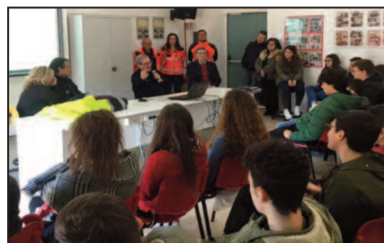
UN MOMENTO DELL'INIZIATIVA