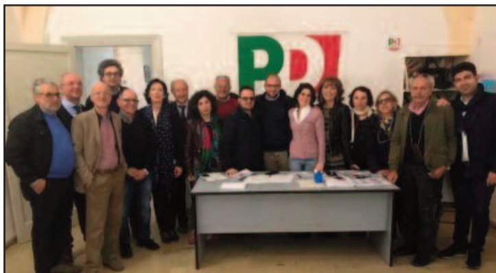
IL P.D. DI MARSALA

ranza. Non c'era nessuno nemmeno in rappresentanza del gruppo che si riconosce nelle posizioni del presidente del Consiglio comunale di Marsala Enzo Sturiano. "Prendo atto che più della metà dei 408 tesserati del Pd ha comunque scelto di non votare", ha dichiarato quest'ultimo, spiegando che la sua componente ha deciso di non partecipare "perché permane uno stato di confusione circa gli organismi dirigenti". In particolare, Sturiano lamenta l'assenza di dialogo all'interno del Pd di Marsala e il mancato coinvolgimento nella preparazione a quest'appuntamento politico. "Per quanto ci riguarda - ha sottolineato il presidente del Consiglio comunale - noi attendiamo ancora risposte sul tesseramento on line, che continuiamo a ritenere valido. Rileviamo inoltre che siamo stati cercati in queste settimane dai promotori delle mozioni Orlando ed Emiliano, ma abbiamo deciso di restare coerenti con le nostre posizioni, ritenendoci organici al progetto di Matteo Renzi". Sulla possibilità che il suo gruppo vada comunque a votare il prossimo 30 aprile alle primarie, la risposta di