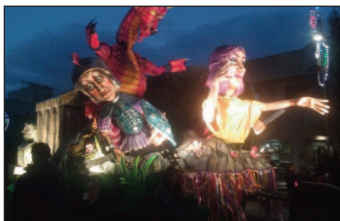
UNO DEI CARRI ALLEGORICI

preferito". Per votare è necessario inserire il proprio codice fiscale (username e password). Sarà possibile esprimere il proprio voto fino alle ore 18 di oggi. I carri in gara sono: "Kung-fu Panda" dell'associazione "Petros-sinis"; "Noi invincibili eroi" del Gruppo Musa; "L'Italia allo sba...raglio!" dell'associazione Micael; "I Romani, meno male che ci siete viate" dell'associazione La speranza. Oltre al premio che si aggiudicherà il primo classificato, verranno consegnati anche il premio per la migliore "Musica e coreografia", il premio "Fantasia - originalità dei costumi" e il premio della critica "Originalità del tema".