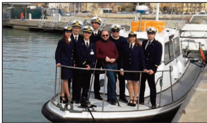
GLI STUDENTI DEL GEOMETRA