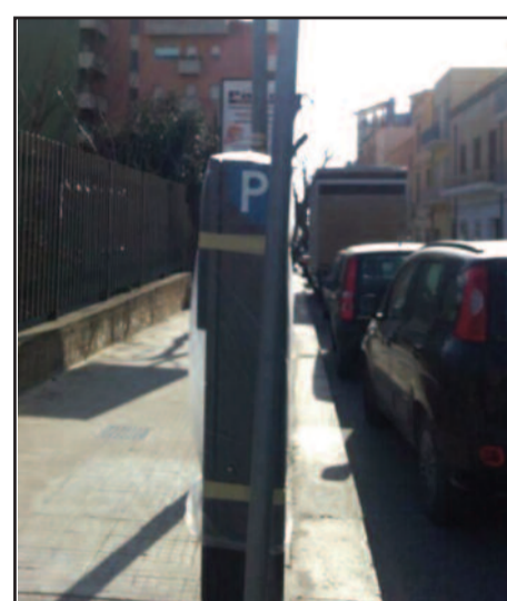
UN PARCOMETRO IN VIA AMENDOLA

per acquistare i park card o in Piazza, a Porta Mazara, o in zona Porticella. Inoltre, all'inizio della via Amendola venendo dall'incrocio con le vie G. Anca Omodei e Pascasino, dove insiste un noto esercizio commerciale di moto, la strada sulla sinistra – che prima era a parcheggio gratuito – diventa riservato agli abitanti del palazzo sul Bastione, che comunque dovranno essere muniti di apposita autorizzazione. Gli operai stanno già provvedendo a dipingere le strisce gialle. Stessa cosa accade in Piazza Castello, vicino all'ex Casa Circondariale. Lungo la stessa via invece, nella parte destra, l'Amministrazione aveva già disposto il divieto di sosta per consentire il passaggio del bus circolare con partenza in zona Stadio.