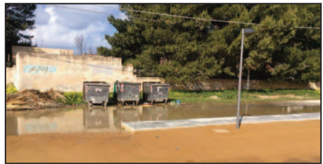
PARCHEGGIO DI BIRGI