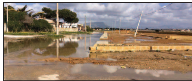
PARCHEGGIO DI BIRGI

Dovrebbero terminare il prossimo 15 febbraio, i lavori del costruendo parcheggio di lido Birgi Sottano ma i primi problemi iniziano ad affiorare. L'associazione omonima, formata dai cittadini del versante nord del marsalese, ha evidenziato che alcuni lavori all'interno del parcheggio dovrebbero ancora essere eseguiti affinché l'opera venga realizzata a regola d'arte, evitando in tal modo che, una volta finita, non si trasformi nell'ennesima opera incompiuta o mal eseguita. Anche perché sarebbe uno sperpero di denaro pubblico. "Il parcheggio necessita di un sistema per l'eliminazione del ristagno dell'acqua piovana dalle vie che costeggiano il parcheggio - affermano dall'associazione Lido Birgi Sottano - la sistemazione della strada, che presenta diverse buche, a causa dei lavori eseguiti; la sistemazione delle aree confinanti