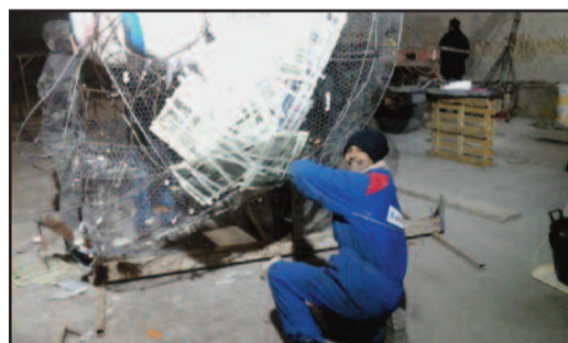
IL CARRO "I FIGLI DEI FIORI" IN COSTRUZIONE

Ritorno al passato degli anni '60 e '70 per il carro di carnevale dell'associazione culturale Gruppo Musa, che sfilerà per le strade di Petrosino. Un carro che rievoca gli anni dei figli dei fiori e lancia un messaggio di pace, amore e libertà. "L'intento non è soltanto quello di vivere il Carnevale in allegria - ci hanno detto i ragazzi dell'associazione -, ma di diffondere il messaggio virtuoso e filosofico adottato dai vari gruppi hippie sparsi nel mondo in quel periodo storico. Anche noi vogliamo portare in giro il nostro messaggio di pace con la realizzazione di un carro allegorico che ha coinvolto tutti i componenti dell'associazione, giovani e meno giovani, che si stanno impegnando per la realizzazione di questo bel progetto". [ ro. ma. ]