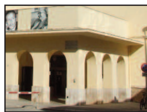
TRIBUNALE DI MARSALA