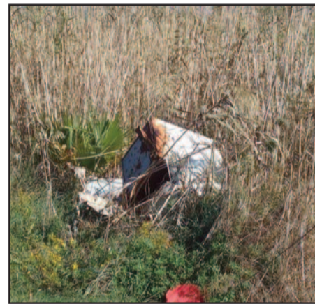
LE DISCARICHE IN CONTRADA GIUNCHI

perché la zona questa estate è stata più volte oggetto di incendi. Sollecitiamo un immediato intervento di bonifica delle discariche abusive e un controllo capillare contro l'abbandono dei rifiuti, ma soprattutto l'installazione di telecamere di videosorveglianza capaci di risolvere alla base il problema punire severamente gli incivili e contrastare ogni