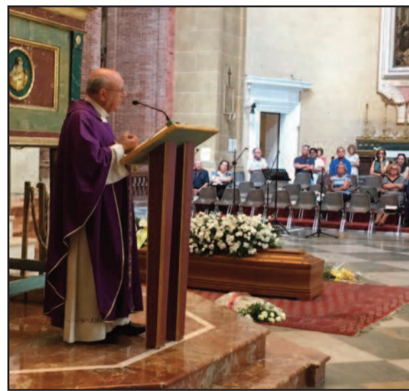
UN MOMENTO DEI FUNERALI