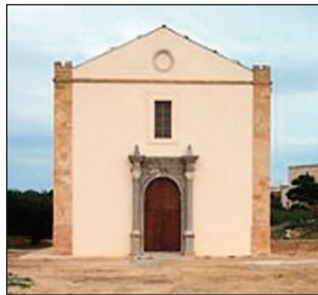
CHIESA DI SAN GIOVANNI

Oggi si celebra la festività del copatrono di Marsala, San Giovanni Battista. Come da tradizione, sono tanti gli appuntamenti che accompagnano l'importante e sentita festività tra i marsalesi. Questa mattina, alle 8.30, alle 10 ed alle 11.30, le sante messe verranno celebrate nella Chiesa di San Giovanni a Capo Boeo; alle 9.30 ed alle 11.30, una Banda musicale suonerà in giro per la Città; alle 19 Santa Messa; alle 20 la processione seguirà questo itinerario: Chiesa San Giovanni, Lungomare Boeo, viale Isonzo, via G. Garraffa, via Garibaldi, piazza Mameli, via dei Mille, piazza Piemonte e Lombardo (breve sosta al porto), via Stefano Bilardello, via Mazzini, via dello Sbarco, via Roma, piazza Matteotti, via XI Maggio, via Armando Diaz, via Lungomare, Chiesa San Giovanni. Alle ore 22.30, ci saranno i tradizionali giochi pirotecnici.